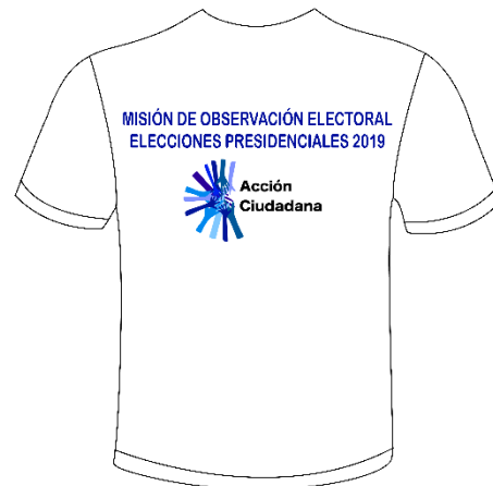
Diseño de camisas de la MOE-AC