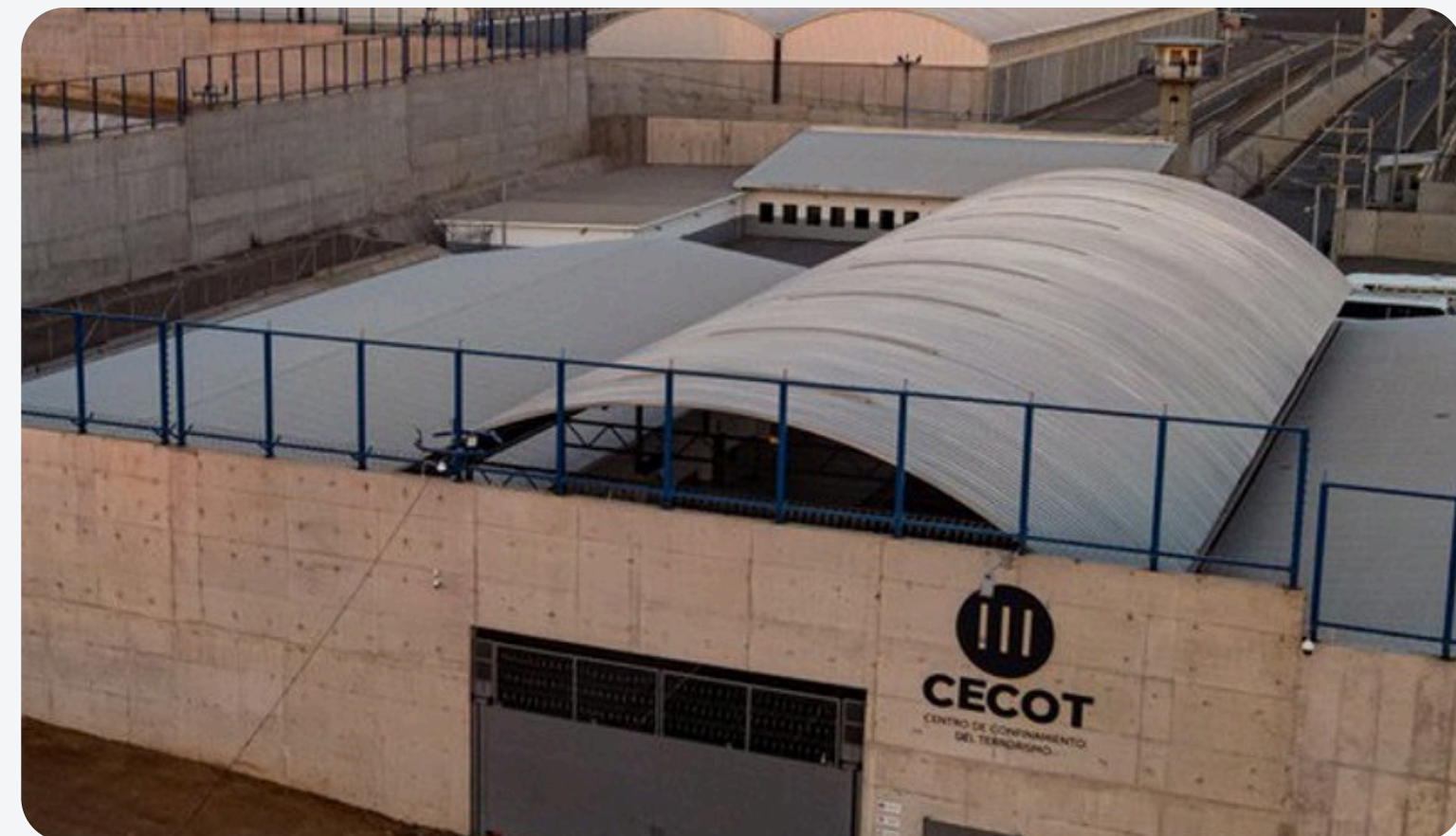
Fotografía sobre el Centro de Confinamiento del Terrorismo